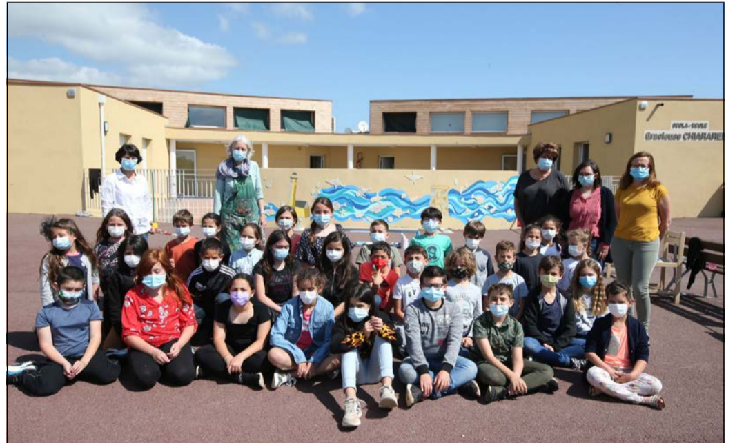
Élèves, encadrants et enseignants devant la fresque.

C'est pourtant une dominante bleue qui a été choisie pour la réalisation de cette fresque, imaginée, dessinée, peinte à même la mur de la cour d'école avec des incrustations en céramique. Une dominante bleue qui est celle de la mer, avec des poissons de Méditerranée, ses coquillages, son rivage et ses roseaux, complétée de la tour génoise, et du phare protecteur du littoral. Un ensemble d'éléments, étudiés et mis en valeur, dans le cadre des