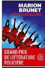
L'été circulaire par Marion Brunet, éd. Le Livre de poche, 256 pages, 7 euros