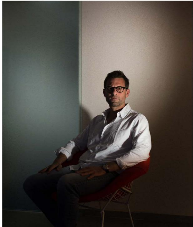
Nicolas Mathieu, écrivain politique mais pas engagé, viendra parler, débattre, échanger, ce vendredi, à Bastia.

Vous êtes attaché à votre région, est-ce que la vie