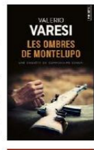
Les ombres de Montelupo (trad. Sarah Amrani) de Valerio Varesi, éd. Points, 370 pages, 7 euros